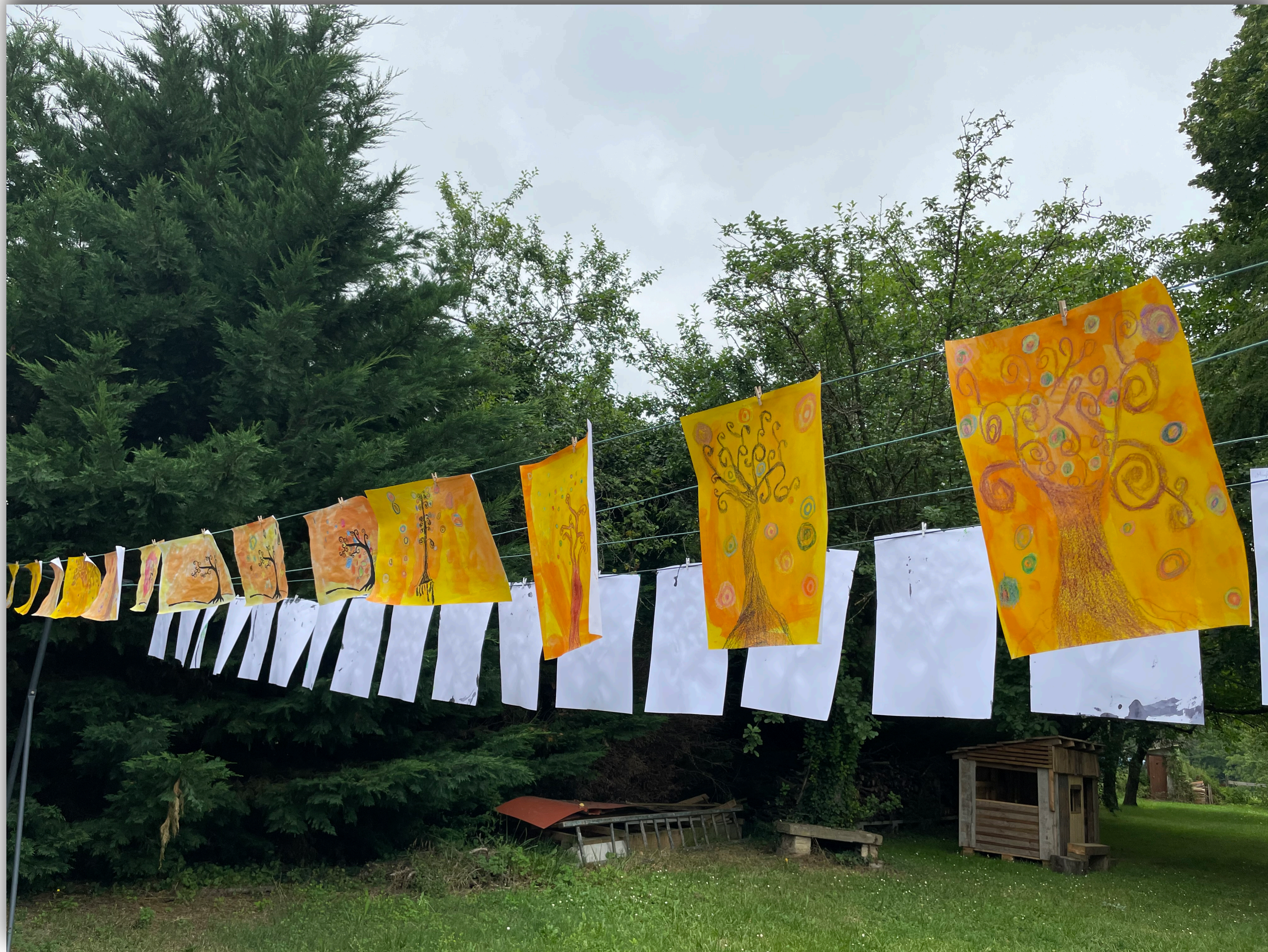
THEA école de Vira