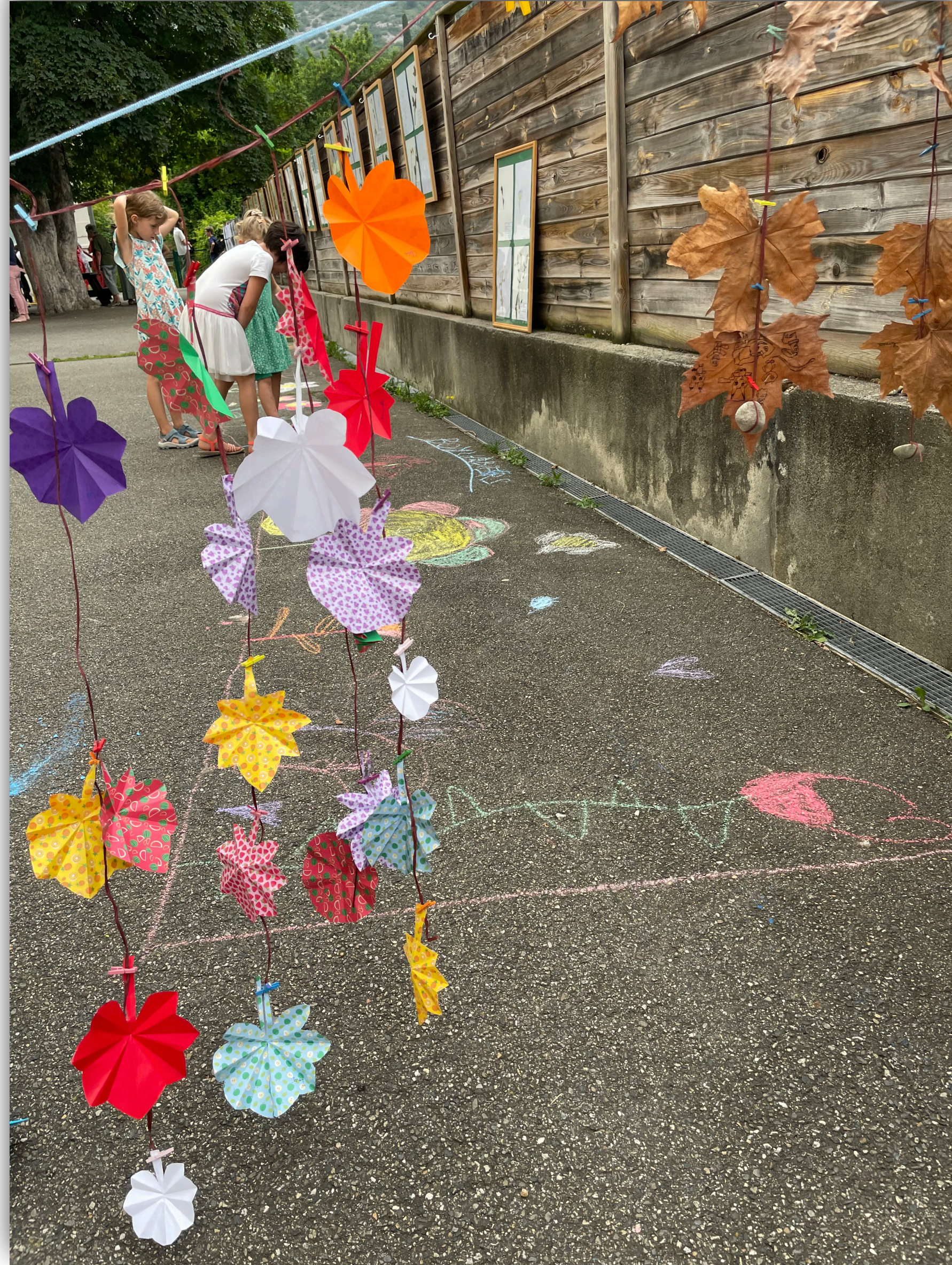
Expo école du Cardié