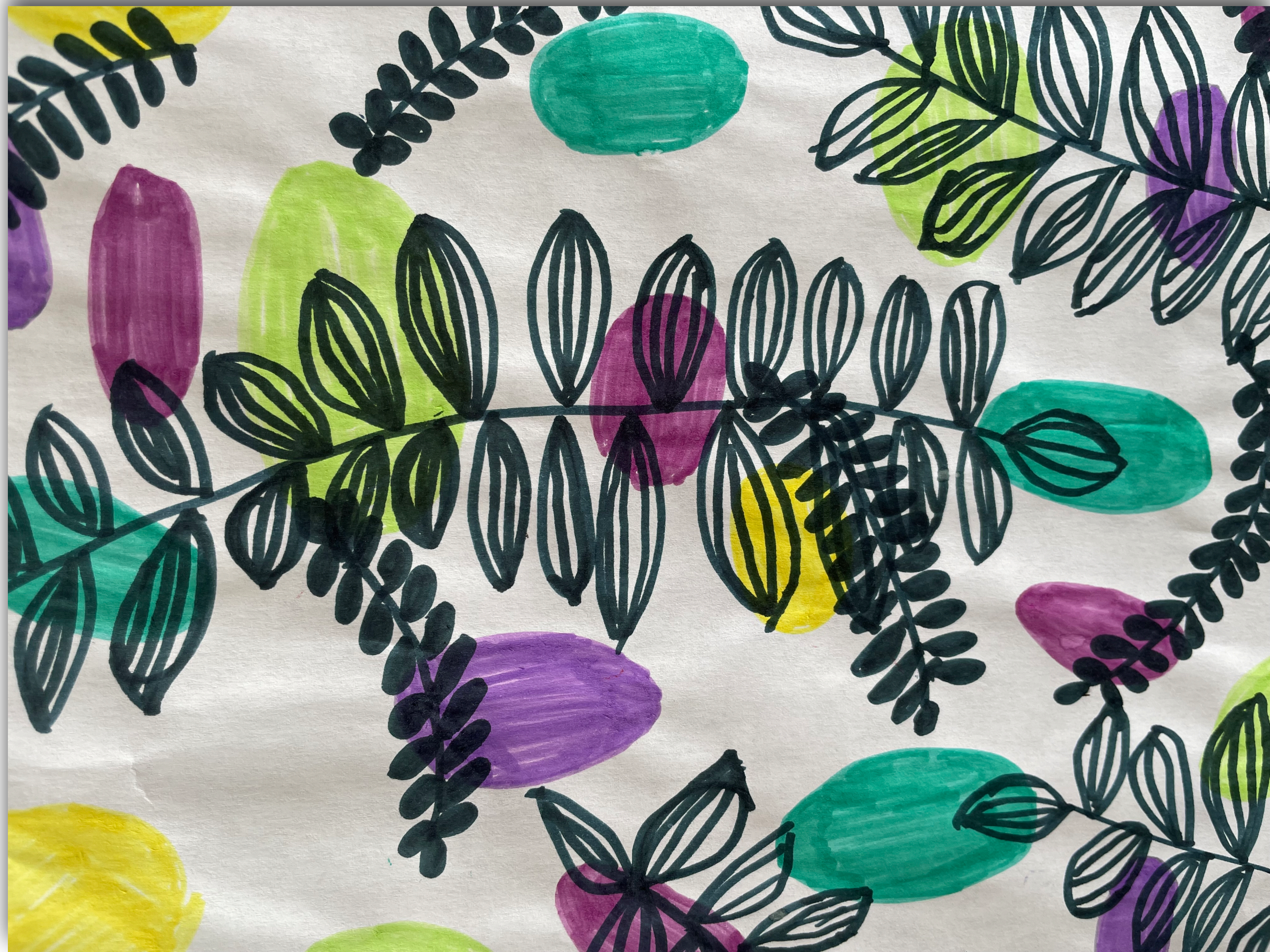
Exposition école du Cardié